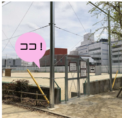
グラウンド入口付近のフェンス