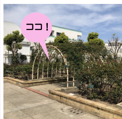
バラ園内のアーチトレリス