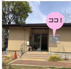
展示施設入口の掲示板