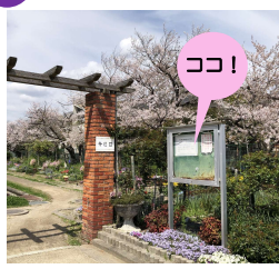
貸し花壇入口の掲示板