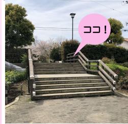
南入口の木製階段