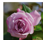
ローズアマガサキ 2016