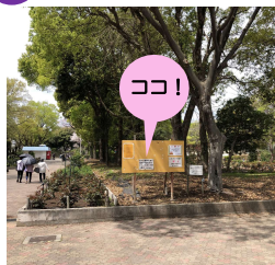
公園東入口すぐの掲示板