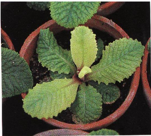
鉄の欠乏症（プリムラ）

土から株を抜いて石灰の入っていない土に植え替えます。葉が黄白色になった株には、市販の微量元素肥料（ヨーゲン強力2号；三井東圧化学など）を水で規定濃度にうすめて、霧吹きなどで葉の表面に散布します。あるいはエードポトリンA号（住友化学園芸）を、水やりの後で土が湿っているときに、株のまわりに数カ所に分けてうすめずにそのまま滴下します。黄白化した葉は元には戻りませんが、新しく広がってくる葉は緑色になります。肥料不足の場合には株は抜かずに、微粉ハイポネックスなどを1000倍にうすめた液肥を1週間に1回、水やりをかねて与えます。施肥後、1週間ほどで葉の色がよくなります。