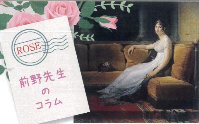
ジョゼフィーヌ・ド・ポアルネ Joséphine de Beauharnais 1763年-1814年 フランス皇后。ナポレオン・ボナパルトの最初の妻。

表紙の画は19世紀初頭にフランスのP.J.ルドゥーテによって描かれた精密なボタニカルアートです。植物画家として有名だったルドゥーテは、バラを愛したナポレオン妃ジョゼフィーヌの要請を受けマルメゾン宮殿のバラすべてを描き「ル・ローズ」にまとめました。