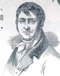
ピエール＝ジョゼフ・ルドゥーテ Pierre-Joseph Redouté 1759年-1840年 南ネーデルラント出身のベルギーの画家

ジョゼフィーヌは世界中のバラをマルメゾン宮殿に集めただけでなく、交配による新しいバラの育成やその普及に尽力しました。現代バラはジョゼフィーヌによって生み出されたと言えるでしょう。