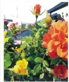
バラがとってもきれいな グリーンヘルパーさんの ベランダ