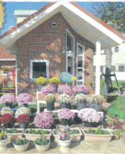
学校緑化部門 からたち幼稚園 様