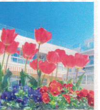
学校緑化部門 明和幼稚園 様