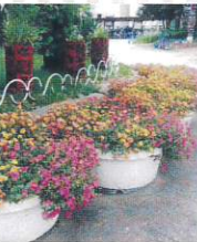
学校緑化部門 立花南小学校 様