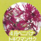
4月ヘゴニア トキワマンサク