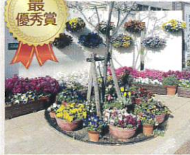
学校緑化部門 上坂部小学校 様