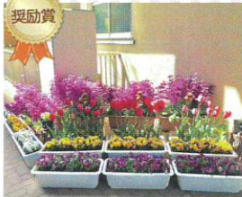
学校緑化部門 武庫東小学校 様