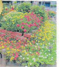
コミュニティ緑化部門 猪名寺駅前花壇 様