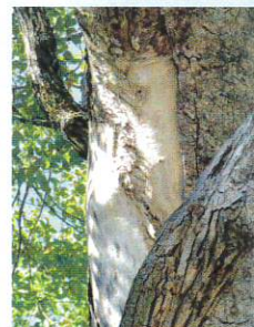
平成12年5月2日、雷に打たれた痕が残る