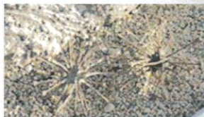
「ライオン殺し」と名付けられた実

マダガスカル西部原産の落葉低木で、現地では高さ5mになります。幹の基部が肥厚することから一般に多肉植物として扱われています。葉を握るとほのかにゴマの香りがします。現地では「シャンブーの木」と呼ばれていて、葉を水に浸すと粘液が分泌されシャンブーやハンドソープとして利用され、育毛・増毛の効果があるとされています。実は鋭い返しのあるトゲがつき、動物の体にひっつき遠くまで運ばれ生育地を広げます。動物が血だらけになることもあることから「ライオン殺し」と物騒な名前がつけられた実で、属名のウンカリーナは「鍵状の爪」の意です。残念ながら一株では結実しません。当園温室では3月下旬から5月下旬にかけて開花しますが、温室の上部天窓近くで咲くため見上げてご覧ください。(田上義信)