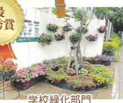
学校緑化部門 尼崎市立上坂部小学校