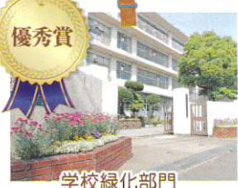
学校緑化部門 兵庫県立尼崎高等学校