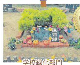
学校緑化部門 兵庫県立武庫荘総合高等学校園芸部