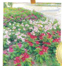
コミュニティ緑化部門 ワンネスあまがさき