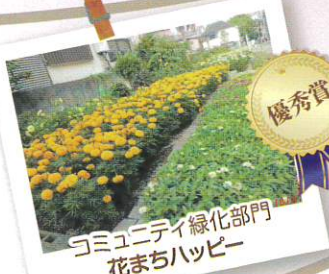
コミュニティ緑化部門 花まちハッピー