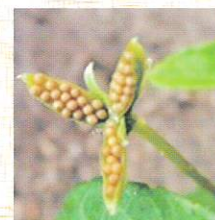
はじく前の果実と種子

春が過ぎ、スマレ類の開花時期が終わりに近づくと受粉した果実が膨らみ種子を散布し、子孫を残します。その後、夏から秋にかけて花が咲かないにも関わらず、いつのまにか果実ができてことがあります。これはスマレ類の特徴で、花が咲き虫や風などの振動で受粉を行う花と、閉鎖花と呼ばれる花弁を開かずに自家受粉する花の両方が存在するからです。閉鎖花は小さくて目立ちません。