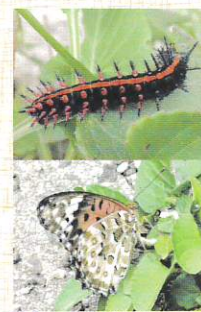
産卵中のツマグロヒョウモン

葉は食べられてしましますが、見かけによらずおとなしい虫で毒もなくさしたりもしません。春から秋頃、メスの成虫は産卵のためスマレ類を探し街なかを必死で飛び回っています。