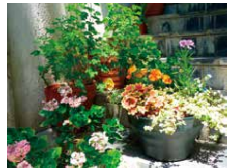
写真は半日ほど、陽の当たる場所の栽培例です。

緑の相談所では緑と花のある充実した暮らしのお手伝いとして、季節ごとにベランダ園芸の講座を行っています。興味を持たれた方は、ぜひ一度ご参加ください。