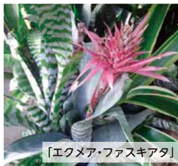
「エクメア・ファスキアタ」

ラン科カトレア属/小型の着生ラン。ミニカトレアの交配親にもなっている。主にブラジルのサンパウロ州に自生しており、写真はブラジル南部の海岸段丘の自生地で撮影されたもの。