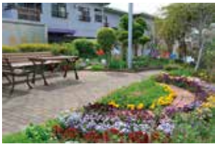
ボランティアグループ その 園 様