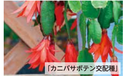
「カニバサポテン交配種」

ナス科ペチュニア属/夏が近づくると園芸店でよく見かけるなじみのある花。原種の自生地はブラジル南部のほか南米の数ヶ所に分布。ペチュニアとはブラジルでたばこを意味する「petun」ペチュンから由来。