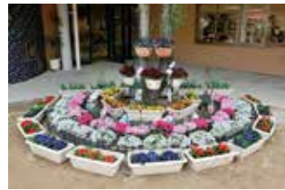
立花愛の園幼稚園 様