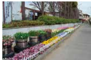
潮江連協 「グループ花の道」 様