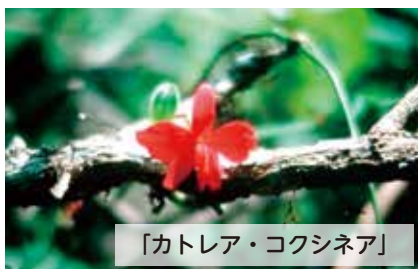
「カトレア・コクシネア」

フトモモ科ミルキアリア属/ブラジル南部原産の常緑小高木。白い花が幹に直接咲いたあと、ブドウのような実が成り、食用にできる。