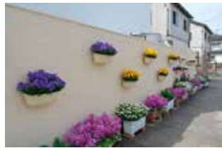
西武庫 れんげグループ 様