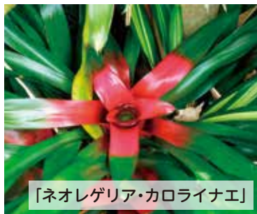
「ネオレゲリア・カロライナエ」

サポテン科シュルンベルグ属/ブラジルに分布する着生サポテン。リオデジャネイロ州オルガン山の高地に自生している。花の時期は2月頃。姿の似ているシャコバサポテンはカニバサポテンより低地に自生している。