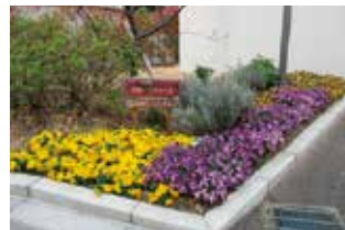
ゆめパラティース 様