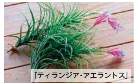
「ティランジア・アエラントス」

パイナップル科エクメア属/本属の多くが着生種。南アメリカの熱帯地域に分布。ロゼット状の葉の中央から伸びる花(苞、萼)はピンク色で、約3ヶ月という長い期間観賞できる。