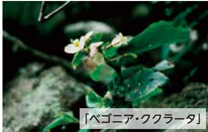
「ベゴニア・ククラータ」

シュウカイドウ科ベゴニア属/四季咲きベゴニア、センパフローレンスの交配親のひとつといわれている。湿気の多い斜面に自生する。写真はサンパウロ州で撮影されたもの。