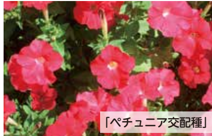
「ペチュニア交配種」

シュウカイドウ科ベゴニア属/四季咲きベゴニア、センパフローレンスの交配親のひとつといわれている。湿気の多い斜面に自生する。写真はサンパウロ州で撮影されたもの。