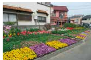
花まちハッピー 様