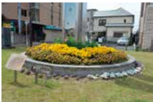
都会のオアシスの会 様