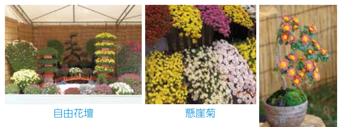
自由花壇 懸崖菊 盆栽菊