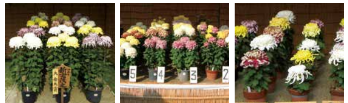
大菊12鉢花壇 だるま作り 福助作り

キ クには野生のキクと園芸観賞用のキクがあります。観賞用の栽培ギクには春菊 ハルギク 、夏菊、秋菊、寒菊とありますが、伝統的な菊づくりに使われるのは主に秋菊です。頭花の大きさによって、大菊、中菊、小菊と分類され、そこから品種や仕立て方が枝分かれしていきます。大菊は花の直径が6寸(18センチ)以上のもので、仕立て方には三本立て、だるま、福助などがあります。秋に恒例の全国の菊花展には、丹精を込めて1年間育て、仕立てられた作品が並びます。