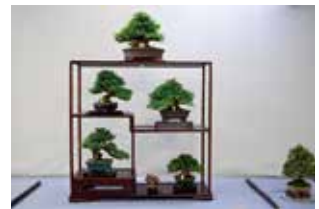
▲小品盆栽と山野草展の様子