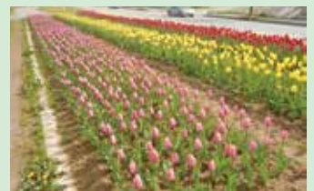
▲宮城県気仙沼市(花のみち45)