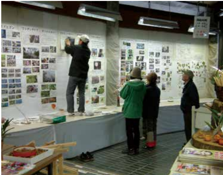
△グリーンヘルパーのみなさんが一年かけて観察して作成した「上坂部西公園で見られる椿・桜展」の準備の様子

また、毎月第4土曜日の11時から、公園の見頃の植物をその月ごとにテーマを決めて案内する「上坂部西公園ガイド」を行っています。時間は、40分～1時間程度。公園をいつも丁寧に観察しているボランティアさんだからこそ、興味深い内容のガイドです。申込は不要、費用も無料です。時間前に緑の相談所前へお集まりください。