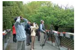
▲野鳥観察会の様子