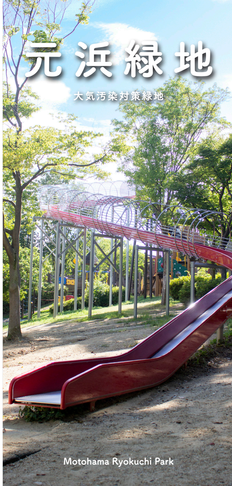
Motomahara Ryokuchi Park