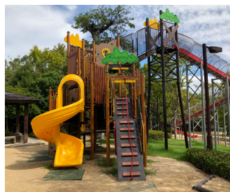
大型アスレチック遊具