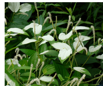
公園に咲くハンゲショウ