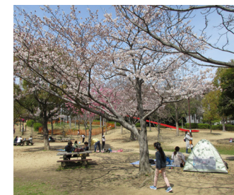
テーブルもある芝生広場