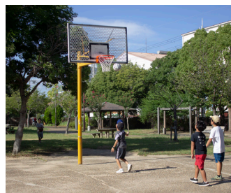
バスケットゴール